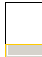
1/4 Seite S: 185 x 65 mm A: 210 x 80 mm

S: Satzspiegelformat, Breite x Höhe in mm A: Anschnittformat, Breite x Höhe in mm, zzgl. 5 mm Beschnitt