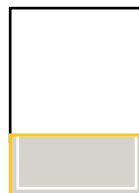
1/3 Seite quer S: 185 x 85 mm A: 210 x 100 mm