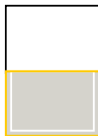
1/2 Seite S: 185 x 124 mm A: 210 x 140 mm